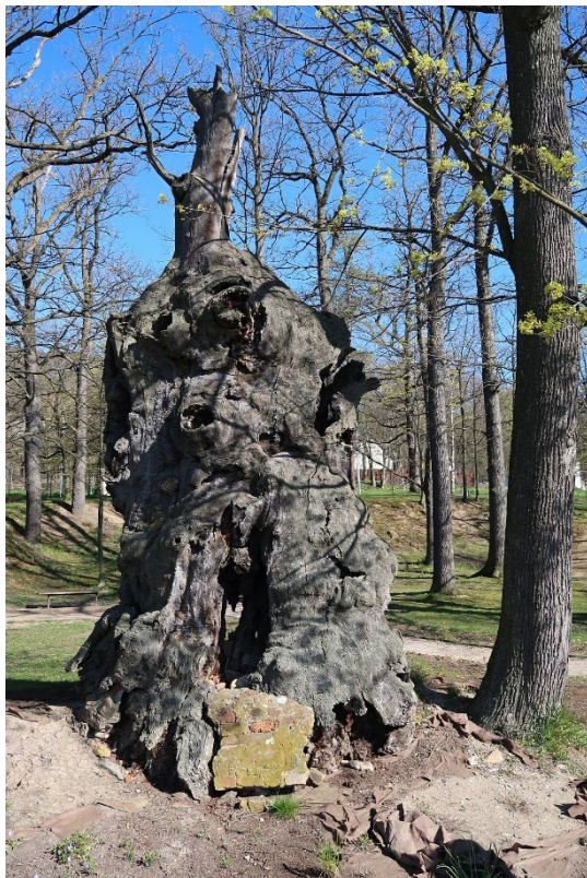
Obr. 7. Torzo mrtvého kmene památného dubu v Oseku. Pohled z Tyršovy ulice.

Fig. 7. The torso of the dead trunk of the monumental oak tree in Osek town. View from the Tyršova street.