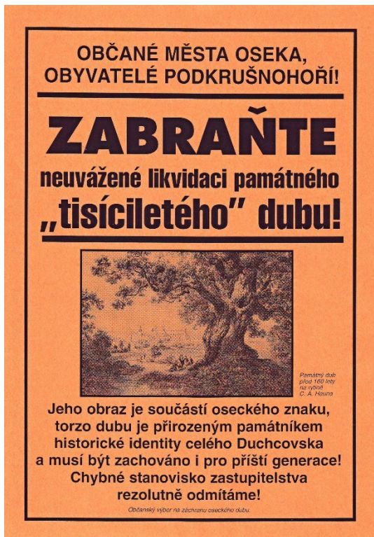
Obr. 5. Plakát občanského výboru na záchranu oseckého dubu. Jeho prostřednictvím byla v září roku 2000 informována veřejnost o bezprostředním ohrožení torza dubu zničením. Skutečná velikost je 210 × 297 mm. Soukromý archiv J. Drbohlava.

Na studii M. Tomáška a odborné posudky zareagoval starosta svoláním neveřejného jednání zastupitelstva města na 6. září 2000, které mělo předcházet jeho veřejnému zasedání plánovanému na 26. září 2000. Jedním z hlavních bodů programu měla být otázka řešení narušené stability torza