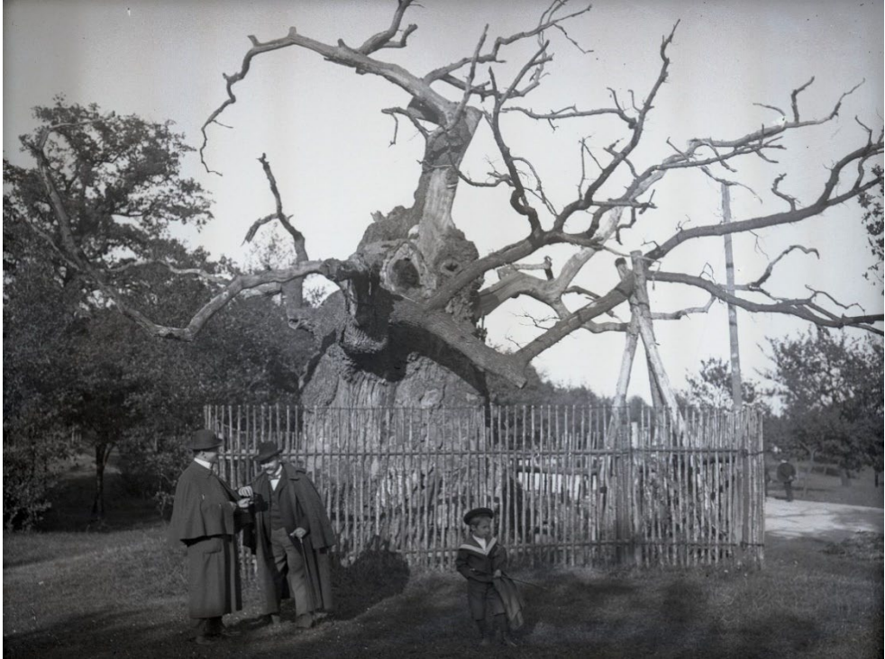
Obr. 4. Památný dub v Oseku. Fotografie od neznámého autora z přelomu 19. a 20. století. Sbirka Oblastního muzea a galerie v Mostě.

Fig. 4. The monumental oak tree in Osek town. Photo by an unknown author from the turn of the 20th century. The collection of the Regional Museum and Gallery in Most.