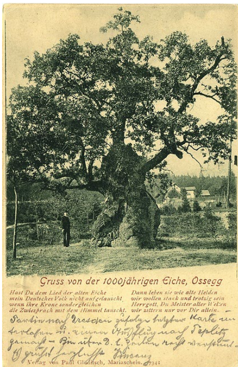
Obr. 2. Památný, tzv. „Tisíciletý“ dub v Oseku. Pohlednice s fotografií od neznámého autora, pohled na dub před koncem 19. století (převzato z webu TECHNISCHE UNIVERSITÄT CHEMNITZ 2011).

Fig. 1. The monumental, so called ‘Millennial’ Oak tree in Osek town. Photo acquired by the Carl Pietzner studio in Teplitz (Teplice town) in winter 1894–1895. Taken from WIKIPEDIA (2022).