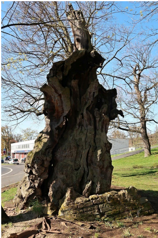
Obr. 6. Torzo mrtvého kmene památného dubu v Oseku.

Snaha místní občanské iniciativy oslovila i řadu dalších místních obyvatel. O plánované veřejné jednání zastupitelstva města na konci září byl mimořádně velký zájem veřejnosti. Vznikla rozsáhlá diskuze, která odstartovala další jednání ve věci odstranění či zachování torza dubu (KOUKAL 2000b, [VACL] 2000). Starosta města a osečtí radní dospěli k odložení jejich předjednaného záměru ([VACL] 2000) a k proklamaci, že další budoucnost torza památného dubu závisí na místních obyvatelích (TATÍČEK 2000). Snahy vedoucí k záchraně zbytku památného dubu trvaly déle než jeden rok